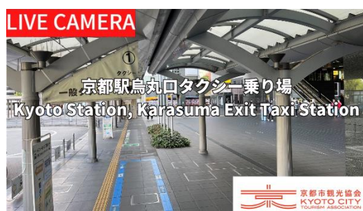
京都駅烏丸口タクシー乗り場