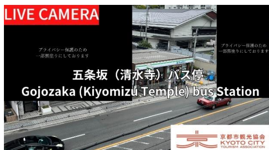
五条坂バス停留所

※ 個人情報保護の観点から踏まえ、黒塗りや解像度を落として放映するとともに、録画は行いません。