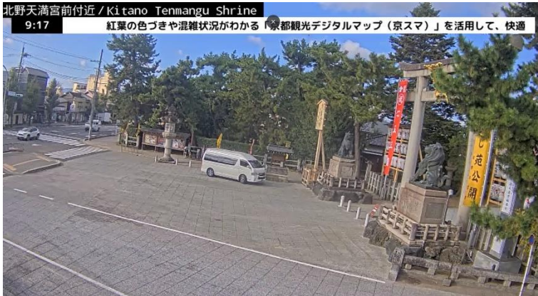
配信イメージ例（北野天満宮ライブカメラ）