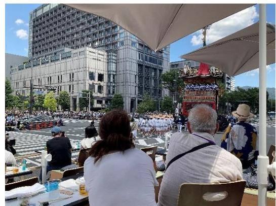
昨年(令和5年)祇園祭プレミアム観覧席の様子