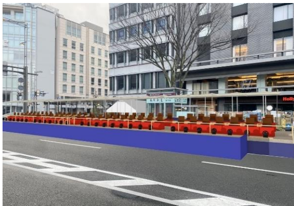
令和6年祇園祭プレミアム観覧席（イメージ）